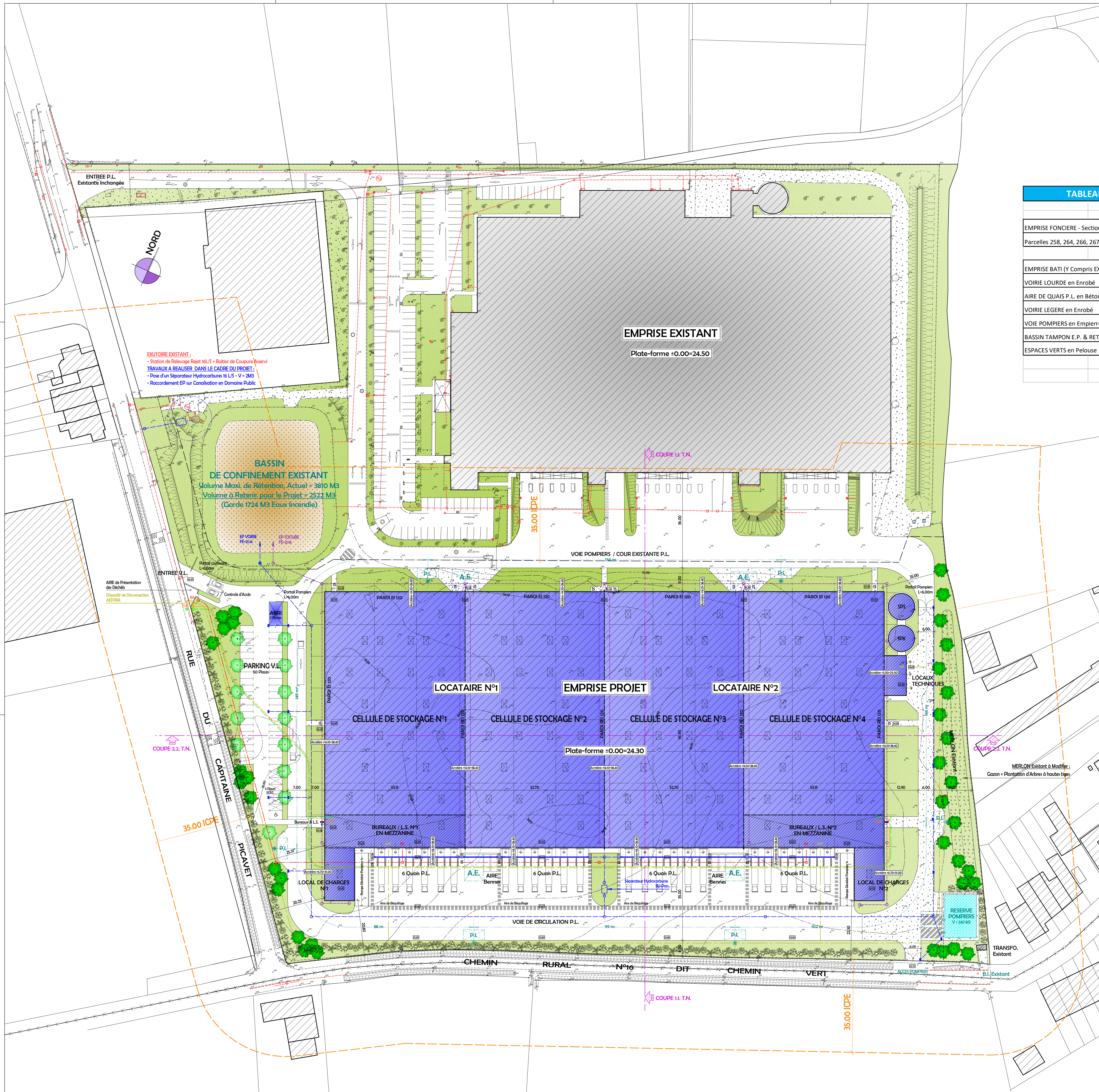
TABLEAU DES SURFACES EXTERIEURES - 2021